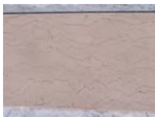
Trani Filetto Rosso

La Azzollini Francesco marmi snc oltre alla pietra e il serpeggiante propone una vasta gamma di materiali quali: