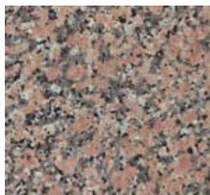
Granito Rosa porrinho