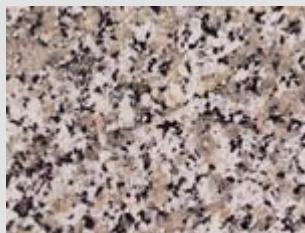
Granito Rosa Beta